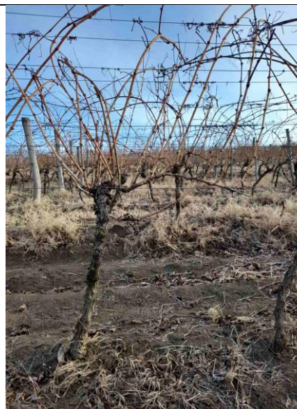
LD Leova, Fetească neagră (situația la 31.01.2022)