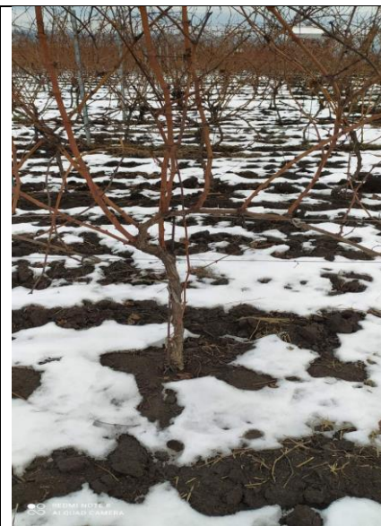
LD Nisporeni, Fetească neagră (situația la 29.01.2022)

Constatări: Pe parcursul lunii ianuarie, la toate sectoarele viticole luate în evaluare, vița-de-vie s-a aflat în faza fenologică "Repausul fiziologic".