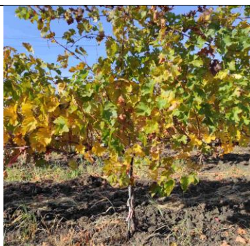
LD Tomai, Merlot (situația la 31.10.2022)