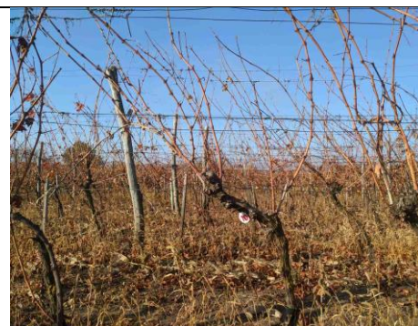
LD Leova, Fetească neagră (situația la 31.10.2022)