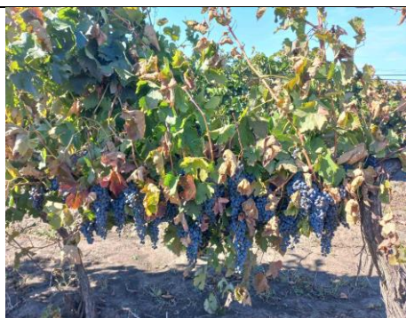
LD Coștangalia, Merlot (situația la 10.10.2022)