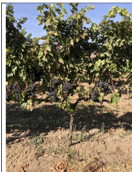
LD Purcari, Fetească neagră (situația la 30.09.2023)