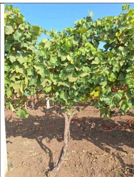
LD Tănăstari, Chardonnay (situația la 30.09.2023)

Constatări. Pentru soiul Fetească neagră, până în data de 10.09...03.10.2023 a continuat faza fenologică „Maturarea boabelor”, după care, începând cu data de 11.09...04.10.2023 s-a înregistrat maturarea deplină a boabelor.