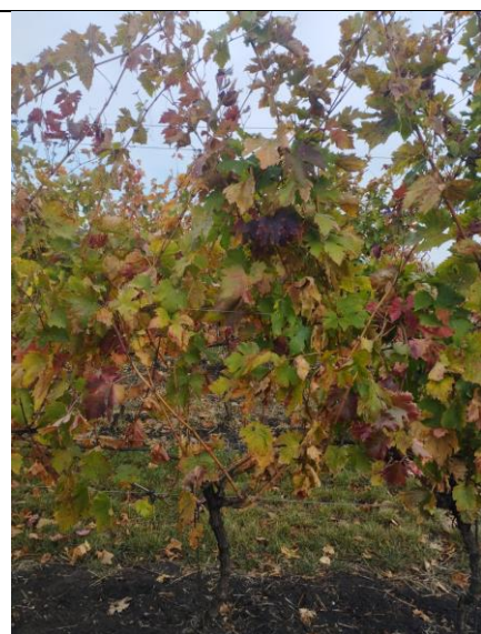
LD Cricova, Fetească neagră (situația la 31.10.2023)

Constatări. Pentru soiul Fetească neagră, până în data de 10.09...03.10.2023 a continuat faza fenologică „Maturarea boabelor”, după care, începând cu data de 11.09...04.10.2023 s-a înregistrat maturarea deplină a boabelor.