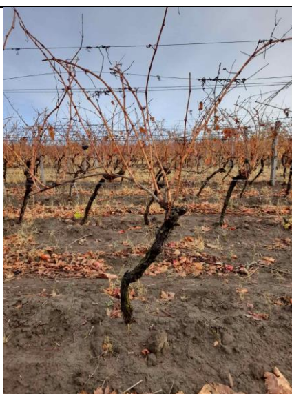
LD Nisporeni, Fetească neagră (situația la 31.10.2023)