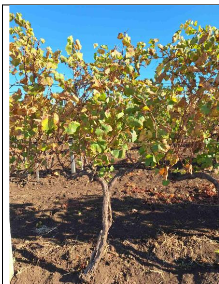
LD Tănădari, Chardonnay (situația la 31.10.2023)