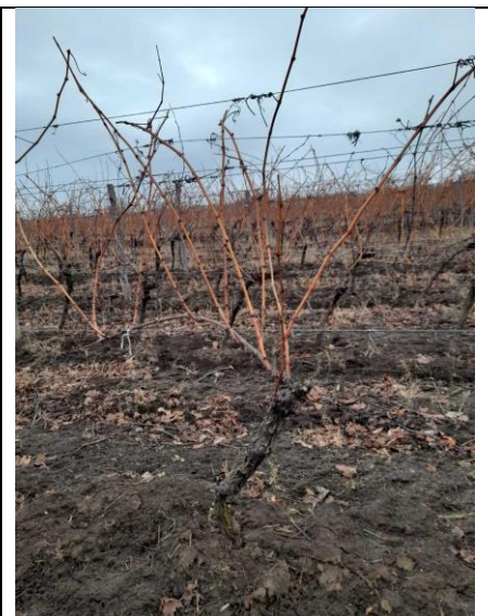
LD Nisporeni, Fetească neagră (situația la 30.11.2023)

Constatări. La vița-de-vie de soiul Fetească neagră, în foarte puține locații viticole – începând cu 11...12.10.2023 (după înregistrarea primelor înghețuri de toamnă), s-a înregistrat începutul forțat al fazei fenologice „Căderea frunzelor” și, care s-a finalizat în 25...27.10.2023. În majoritatea plantațiilor viticole faza fenologică „Căderea frunzelor” a început, în mod natural, în 26...27.10.2023 și s-a finalizat în 26...27.11.2023.