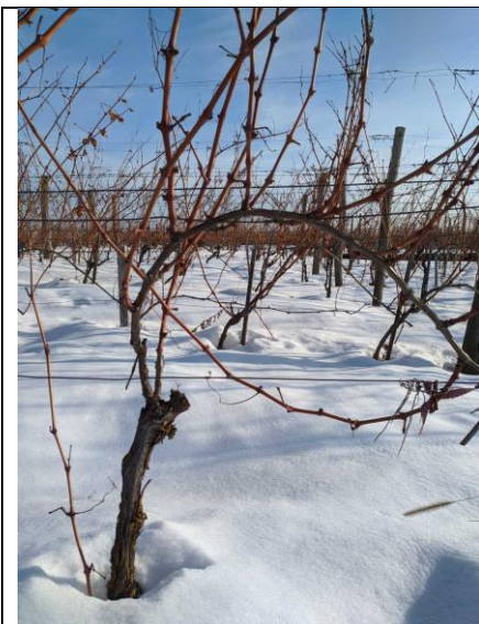
LD Leova, Fetească neagră (situația la 30.11.2023)