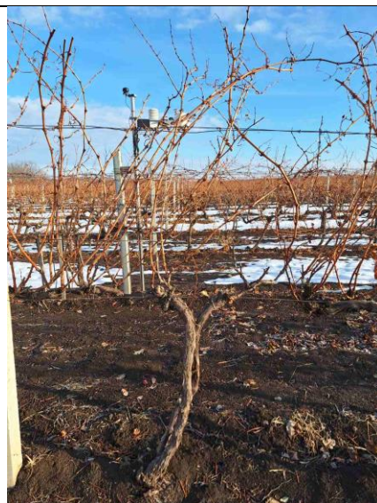
LD Tănătari, Chardonnay (situația la 30.11.2023)